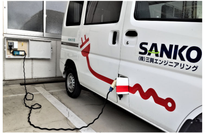
(株)三興エンジニアリング