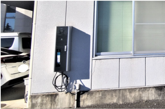
群馬県桐生市 某工場様