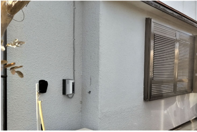
群馬県みどり市 M様邸