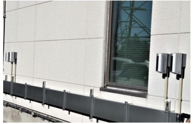
群馬県桐生市 某企業様